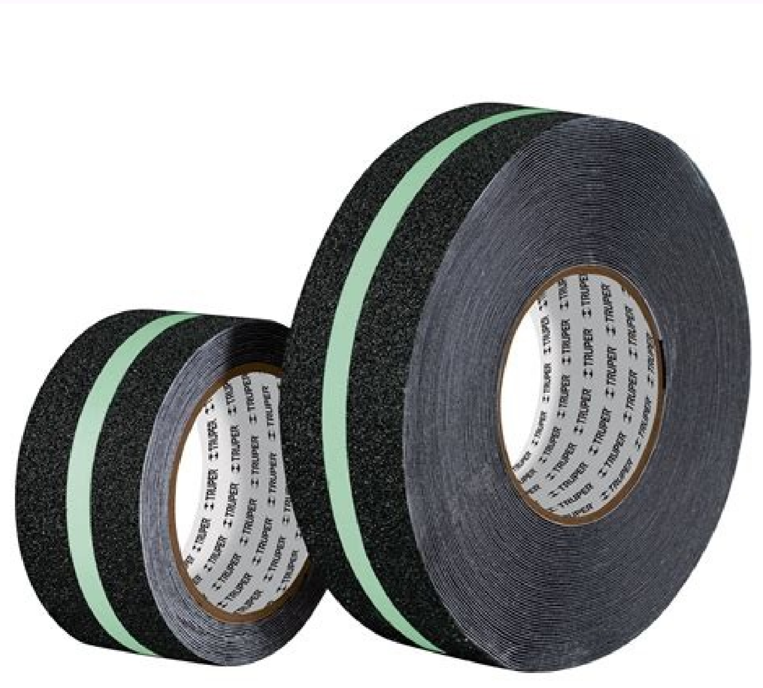
*La foto del producto no necesariamente corresponde a la medida del producto